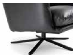
Sternfuß schwarz matt Star-shaped black matt