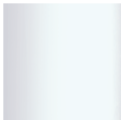
Sternfuß Chrom glanz Star-shaped gloss chrome