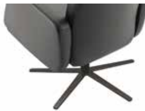
Sternfuß anthrazit matt Star-shaped anthracite matt