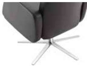
Sternfuß Chrom glanz Star-shaped base in gloss chrome

The chair is optionally supplied with motorised head section adjustment (subject to surcharge).