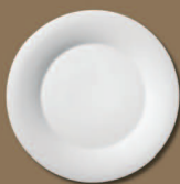
Speiseteller Dinner Plate Ø 280 mm · Nr.: 31012800