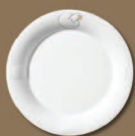
Kinderteller Küken Children's Plate Chick Ø 220 mm · Nr.: 31010214