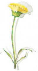
06 Ferkelkraut Cat's ear