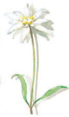
05 Edelweiß Edelweiss