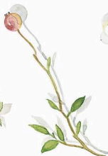
SALZSTREUER SALT SHAKER Moosbeere Cranberry