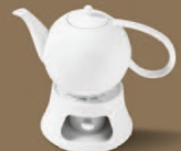
Portionskännchen · Stövchen Pot small · Tea Warmer Ø 230/122 mm · H 102/65 mm 0,5l · Nr.: 31411000/31930000