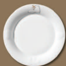
Kinderteller Schuh Children's Plate Shoe Ø 220 mm · Nr.: 31010114