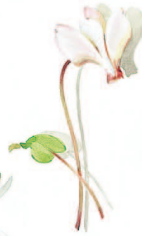
03 Alpenveilchen Cyclamen