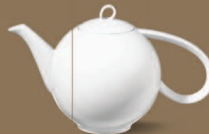
Kanne groß Pot large Ø 154 mm · H 175 mm · 1,3l Nr.: 31405000