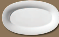
Platte oval, mittel Oval Platter medium Ø 350 x 242 mm · H 35 mm Nr.: 31123500