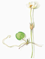
KANNE GROSS POT LARGE Froschbiss Frogbite