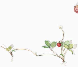
RAG-OUTDECKEL COVERED VEGETABLE DISH LID Walderdbeere Woodland strawberry