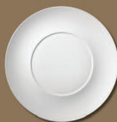
Plattteller Service Plate Ø 330 mm · Nr.: 31013300