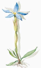
SAHNEGIEßER CREAMER Frühlingsgenzian Spring gentian