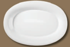
Platte oval, groß Oval Platter large Ø 400 x 284 mm Nr.: 31123900