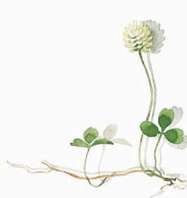
ZUCKERROSENDECKEL SUGAR BOWL LID Weiß-Klee White clover