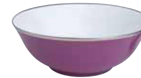
SALADIER ROND OPEN VEGETABLE DISH Ø 25 CM Réf 72