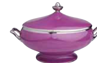
LEGUMIER COVERED VEGETABLE DISH 120 Cl Réf 75