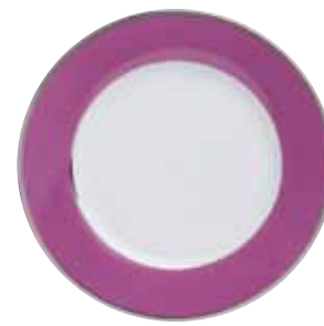
ASSIETTE DÎNER DINNER PLATE Ø 26,5 CM Réf 66