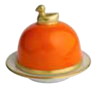
MANDARINE MANDARIN Réf 2068