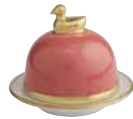
VIEUX ROSE OLD PINK Réf 1083