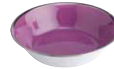
BOL SALADE CEREALE SALAD BOWL Ø 18 CM Réf 63