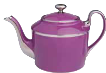
THEIEIRE 6 / 12 TASSES TEA POT 6 / 12 CUPS Réf 49T ( 100 cl ) / Réf 50T (150 cl )