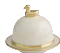
IVOIRE IVORY Réf 1062