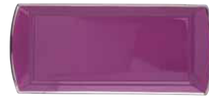
PLAT A CAKE CAKE DISH L 37 CM Réf 86