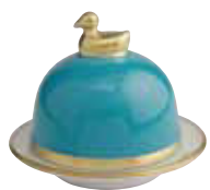
TURQUOISE TURQUOISE Réf 2041