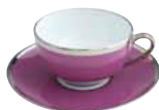
PAIRE TASSE THE TEA CUP & SAUCER Réf 261 ( 15 cl )