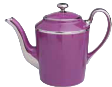
VERSEUSE 6 / 12 TASSES COFFEE POT 6 / 12 CUPS Réf 49V ( 100 cl ) / Réf 50V ( 150 cl )