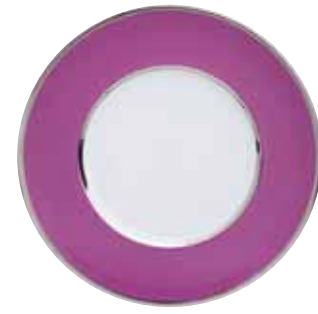
ASSIETTE DÎNER DINNER PLATE Ø 28 CM Réf 670