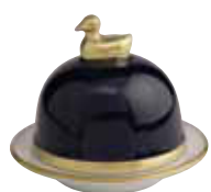
BLEU MARINE NAVY BLUE Réf 5028