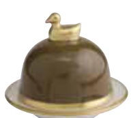
KAKI KAKI Réf 1050