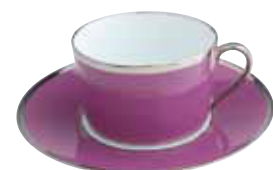
PAIRE TASSE DEJEUNER BREAKFAST CUP & SAUCER Réf 32 ( 25 cl )