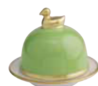
VERT ANIS LIME Réf 1051