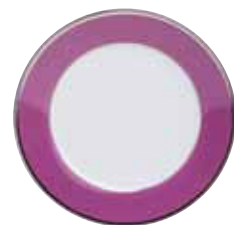
ASSIETTE DESSERT DESSERT PLATE Ø 22 CM Réf 62