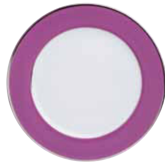
ASSIETTE PRESENTATION CHARGER PLATE Ø 30 CM Réf 68