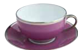
PAIRE TASSE DEJEÛNER BREAKFAST CUP & SAUCER Réf 321 ( 28 cl )