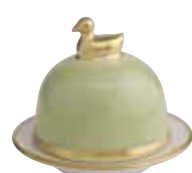
VERT NIL PASTEL GREEN Réf 1049