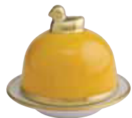
TOURNESOL SUNFLOWER Réf 2063