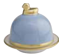
BLEU GLACIER ICE BLUE Réf 1024