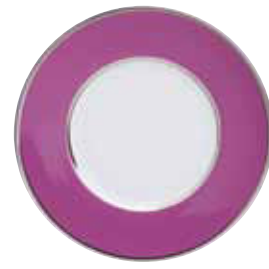
ASSIETTE DESSERT DESSERT PLATE Ø 24 CM Réf 640