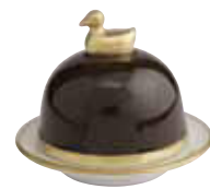
BRONZE BRONZE Réf 1091