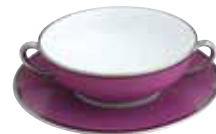
PAIRE BOL BOUILLON CREAM SOUP CUP & SAUCER Réf 37