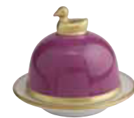
AMETHYSTE AMETHYST Réf 2014