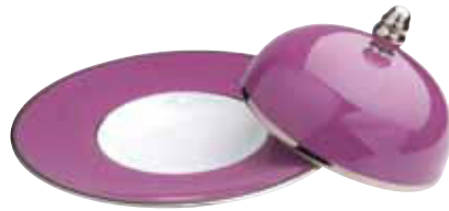
ASSIETTE DEGUSTATION ET CLOCHE GM EXTRA WIDE RIM BOWL AND COVER LARGE Ø 27 CM Réf 16 - Réf 17