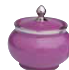
SUCRIER 12 TASSES SUGAR BOWL 12 CUPS Réf 491S ( 30 cl )