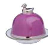
BEURRIER CANARD DUCK BUTTER DISH Réf 112