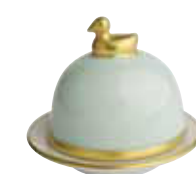
VERT CELADON CELADON Réf 1048