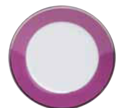
ASSIETTE GÂTEAU CAKE PLATE Ø 18 CM Réf 61