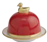
FRAMBOISE RASPBERRY Réf 2089

SOUS LE SOLEIL PLATINE SOUS LE SOLEIL PLATINUM FINISH