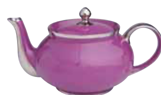
THEIEIRE 12 TASSES TEA POT 12 CUPS Réf 491T ( 100 cl )