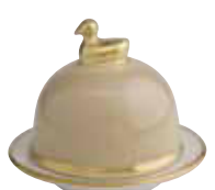
MASTIC MASTIC Réf 1072