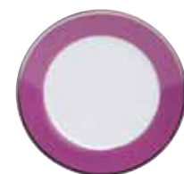
ASSIETTE A PAIN BREAD PLATE Ø 15,5 CM Réf 60