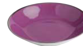
JATTE A CREME CREAM DISH Réf 88