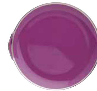
PLAT A GÂTEAUX GÂTEAUX DISH Ø 27,5 CM Réf 70