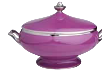
SOUPIERE SOUP TUREEN 200 Cl Réf 71