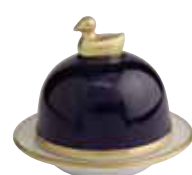
BLEU DE SEVRES SEVRES BLUE Réf 2026