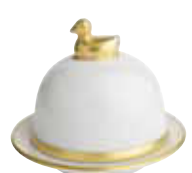
BLANC WHITE Réf 2000