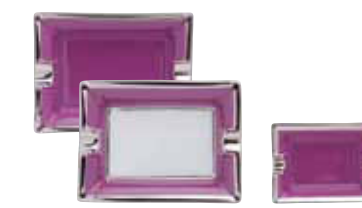
CENDRIER ASHTRAY 11X9 CM / 8X6 CM Réf 134 - Réf 1334 / Réf 135