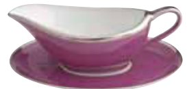
SAUCIERE SUR PLATEAU SAUCEBOAT ON TRAY Réf 73+P