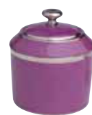
SUCRIER 6 / 12 TASSES SUGAR BOWL 6 / 12 CUPS Réf 49S ( 20 cl ) / Réf 50S ( 25 cl )