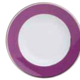
ASSIETTE CREUSE SOUP PLATE Ø 22,5 CM Réf 65