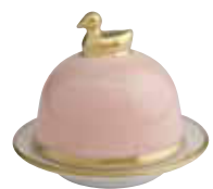
PETALE DE ROSE ROSE PETAL Réf 1082