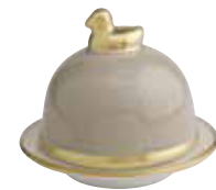
GRIS PERLE PEARL GREY Réf 1094