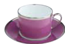
PAIRE TASSE THE TEA CUP & SAUCER Réf 26 ( 15 cl )