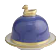
BLEU PROVENCE PROVENCE BLUE Réf 1022