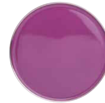
PLAT A TARTE TART DISH Ø 29,5 CM Réf 85