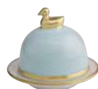
OPALE OPAL Réf 1040