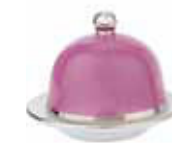
BEURRIER BOULE ROUND BUTTER DISH Réf 110