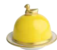
JAUNE CITRON LEMON Réf 2069