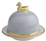
GRIS ARGENTE SILVER GREY Réf 1095