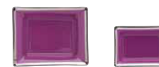
VIDE POCHE RECTANGULAR DISH 11X9 CM / 8X6 CM Réf 131 / Réf 132