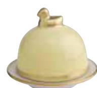
JAUNE PASTEL PASTEL YELLOW Réf 1065