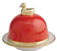
CORAIL CORAL Réf 2087