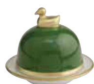
VERT EMPIRE EMPIRE GREEN Réf 1043