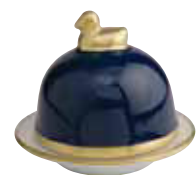
BLEU NUIT NIGHT BLUE Réf 2028