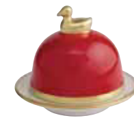
ROUGE RED Réf 2088