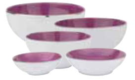
BOLS CANTON CANTON BOWLS Ø 7,5 / 9,5 / 10,5 / 11,5 / 12,5 CM Réf 91 / Réf 92 / Réf 93 / Réf 94 / Réf 95