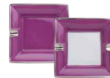
CENDRIER ASHTRAY 16X16 CM Réf 136 - Réf 1365