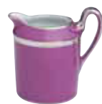
CREMIER 6 / 12 TASSES CREAM JUG 6 / 12 CUPS Réf 49C ( 15 cl ) / Réf 50C ( 25 cl )