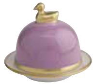
PARME LILAC Réf 1012