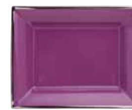
VIDE POCHE RECTANGULAR DISH 19X16 CM Réf 130