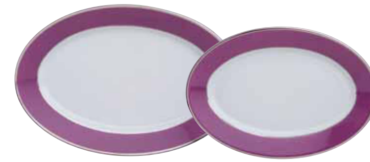
PLAT OVALE OVAL PLATTER L 40 CM Réf 80