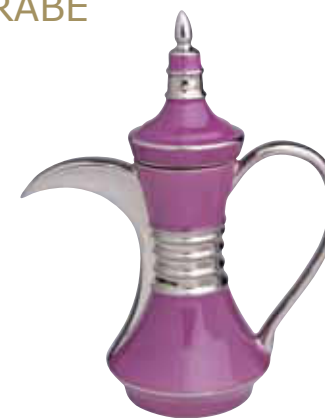
CAFETIERE ARABE ARABIC COFFEE POT Réf 495 ( 60 cl )