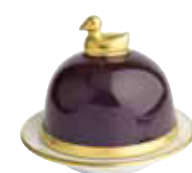
AUBERGINE AUBERGINE Réf 2017