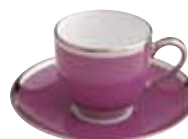
PAIRE TASSE CAFE COFFEE CUP & SAUCER Réf 281 ( 10 cl )