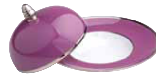
ASSIETTE DEGUSTATION ET CLOCHE PM EXTRA WIDE RIM BOWL AND COVER SMALL Ø 20 CM Réf 11 - Réf 12