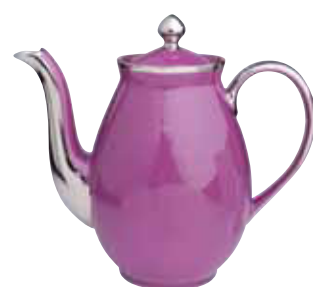
VERSEUSE 12 TASSES COFFEE POT 12 CUPS Réf 491V ( 150 cl )