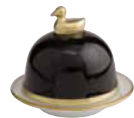
NOIR BLACK Réf 1090