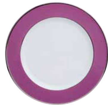
ASSIETTE PRESENTATION CHARGER PLATE Ø 32 CM Réf 69