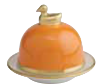
ORANGE ORANGE Réf 2066