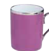
MUG MUG Réf 25 (25 cl)