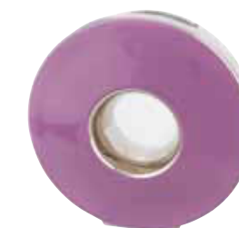
VASE ANNEAU ANNEAU VASE Ø 20 CM Réf VA04