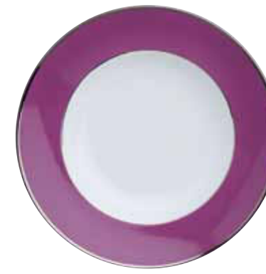
PLAT ROND CREUX ROUND HOLLOW DISH Ø 35,5 CM Réf 77