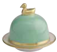
VERT MENTHE MINT Réf 1054