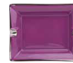
CENDRIER ASHTRAY 19X16 CM Réf 133