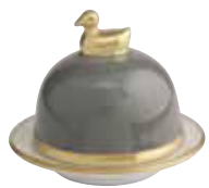
GRIS SOURIS DARK GREY Réf 1093