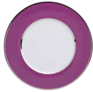
ASSIETTE PRESENTATION CHARGER PLATE Ø 32 CM Réf 690