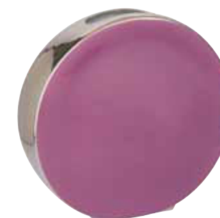
VASE TONNEAU TONNEAU VASE Ø 26 CM Réf VA05