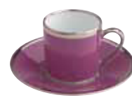
PAIRE TASSE CAFE COFFEE CUP & SAUCER Réf 28 ( 9 cl )