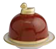
CARAMEL CARAMEL Réf 1075