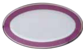
RAVIER HORS D'ŒUVRES DISH L 23,5 CM Réf 74