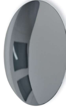
Cr Messing verchromt