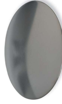
Nm Messing vernickelt, matt gebürstet