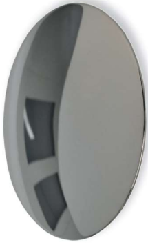
Ni Messing vernickelt