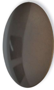
Bd Messing dunkel brüniert, lackiert