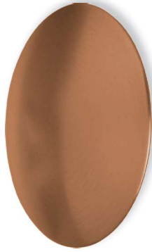
Cm Messing verkupfert, matt gebürstet, lackiert