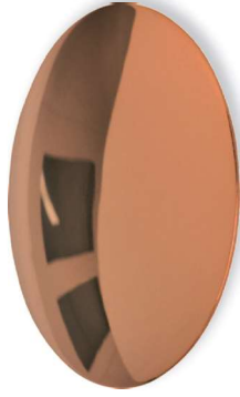
Cu Messing verkupfert, lackiert