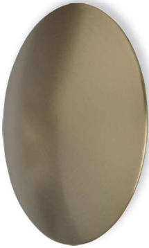
Mt Messing matt gebürstet, lackiert