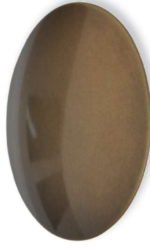
Br Messing brüniert, lackiert