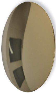
Ms Messing poliert, lackiert