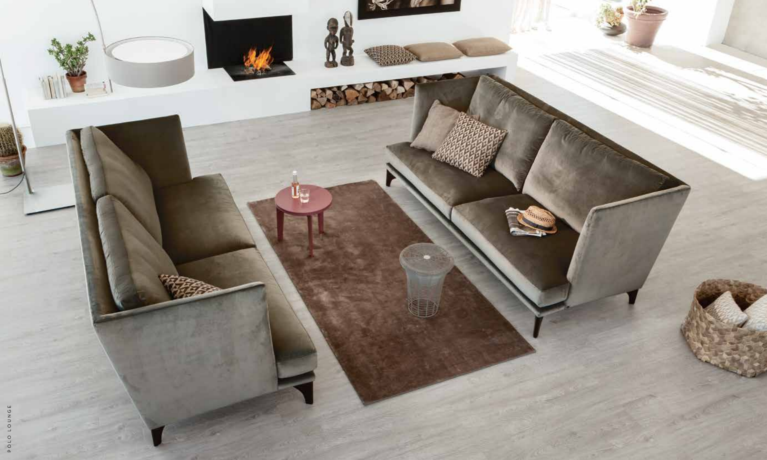
POLO LOUNGE Comfort has never been so gallant.