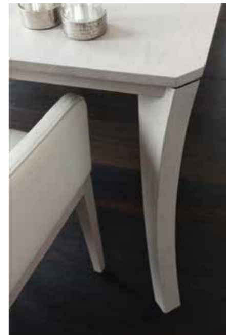
LEONA The best of both worlds.

In vielen modernen Lebenswelten verschmelzen Wohnraum und Esszimmer immer mehr zu einer Einheit. Wo endet ein Bereich, wo beginnt ein neuer? LEONA lässt die Grenzen raffiniert verschwimmen und schafft organisch fließende Übergänge, die Ihren Räumen eine inspirierende Lebendigkeit verleihen.