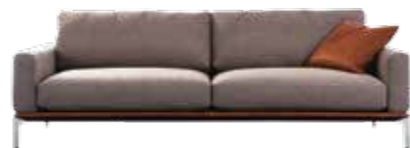
PLANUNGSPROGRAMM Modular concept