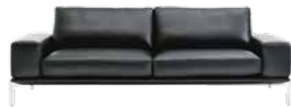
SCHMALE LEHNE Narrow armrest